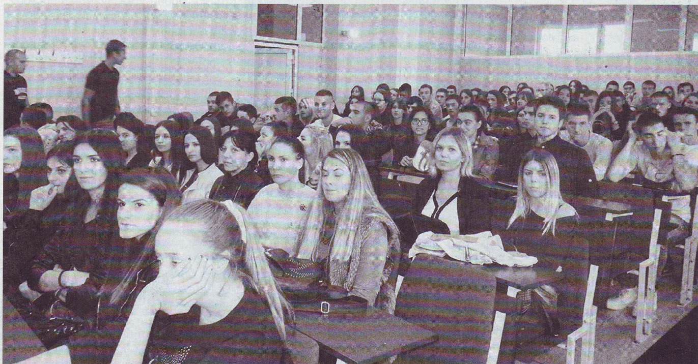
Студенти на почетку школске године